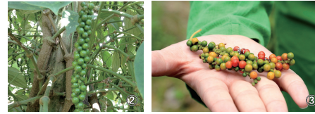
①マレーシア・サワラクの胡椒畑②胡椒の実③熟度ごとに採取され、さまざまな風味・芳香の胡椒が生まれる。