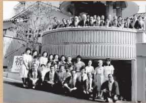
昭和60年6月 釣鐘町 「大坂町中時報鐘」里帰り記念祭