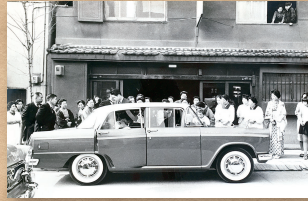
昭和36年1月 内野野町 花嫁は自宅で支度して式場へ