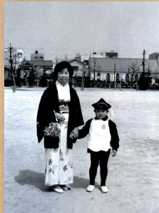
昭和44年4月 中大江公園 中大江幼稚園へ入園。桜の季節の記念撮影は今も見られる。