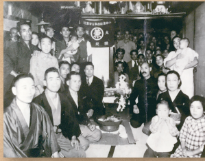
昭和16年4月 石町 運送業を営む家での「護摩焚き」その後、日本は戦争に向かう。これが最後の祈祷だったかも、と。