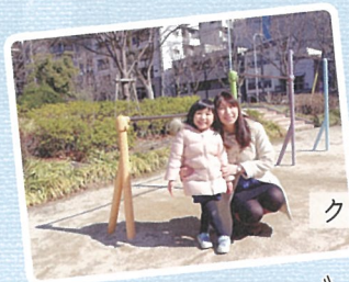
クラシックバレエ