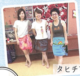
タヒチアンダンス