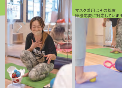
マスク着用はその都度 臨機応変に対応しています。

中央区南新町 1-4-8 アインストーンビル 4 階 火 18:30~20:00/土 13:30~15:00 hippofamilyclub 大阪府 centro pachamamasosaka 0120-557-761 (平日 10:00~17:30)